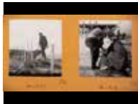
Marsella, Cap-Martin y Le Thoronet