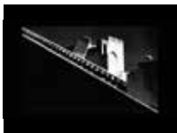
India (1955 y 1961) y Budapest