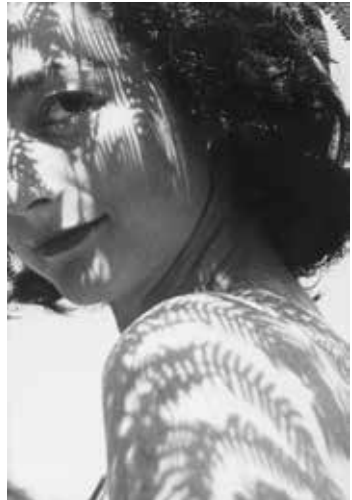
Lucien Hervé en su taller, París. Años 2000