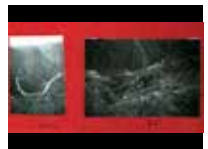
Viaje a Perú, 1961