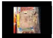
Regreso a Paris, 1965