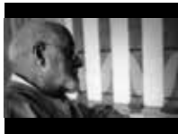
Henri Matisse. Le Corbusier