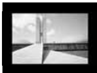
Brasilia, Paris y la periferia