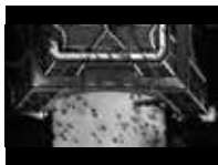
Torre Eiffel, El Escorial y arquitectura popular