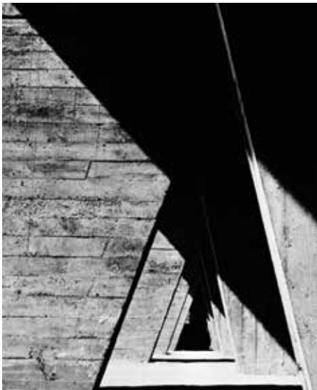
L'ombre de Lucien Hervé, Unité d'Habitation de Marsella. 1951