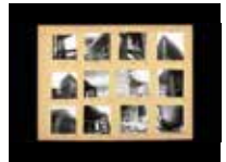
Fotógrafo de arquitectura. Ronchamp