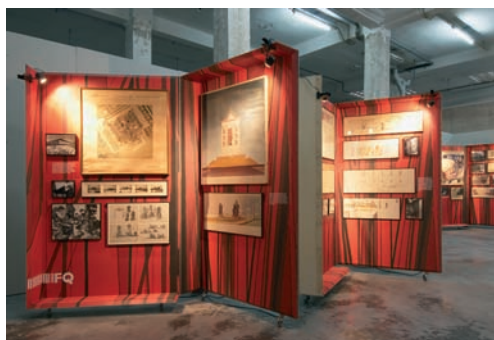
Exposición Rafael Aburto, arquitecto . Centro de Enlace de Arquitectura en Pamplona

Durante el primer cuatrimestre del año se desarrolló la octava convocatoria del programa de becas para estudiantes de Arquitectura y arquitectos recién titulados, orientadas a la realización de prácticas en estudios de arquitectura europeos. El objeto de las becas es contribuir al acercamiento