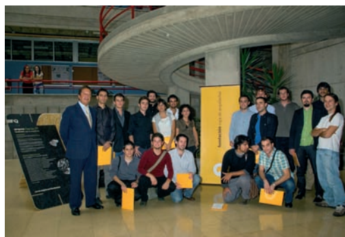
Becarios 2007 con el Presidente de la Fundación.

entre los ámbitos profesional y académico, así como fomentar la movilidad dentro de Europa.