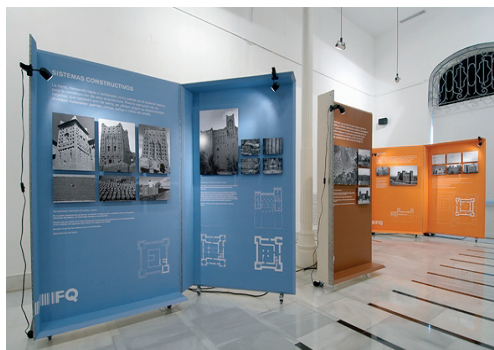
Exposición Arquitectura, tierra y palmeras en Skoura , Sede Colegial de Córdoba